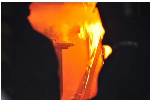
Figuur 3.1 Stagiairs in de container tijdens de oefening voor beginners.

Verschillende mensen kwamen hierbij een handje toesteken. Geert Phyfferoen van brandweer Kortrijk verzamelde een ploeg medewerkers die twee Attack-cellen construeerden. Er werd een groep brandweermensen vanuit de hele provincie geselecteerd om opgeleid/bijgeschoold te worden tot CFBT-instructeur.