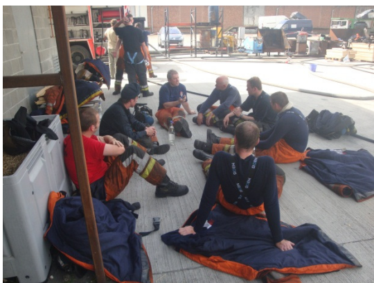
Figuur 2.1 Debriefing tijdens een instructeurscursus op het PIVO.

Het voordeel van de Attack-cell is dat deze heel wat meer mogelijkheden biedt dan de Backdraft-cell. PIVO en OCBB (de Brusselse brandweerschool) besloten dan ook om op eigen benen de CFBT-opleiding verder te zetten. In de tweede helft van 2009 werden de opleidingen met Backdraft-cell aangevuld met opleidingsdagen met de Attack-cell. Tijdens deze nieuwe opleidingsdag wordt theorie gecombineerd met "koude" praktijk: twee basisoefeningen in de container.