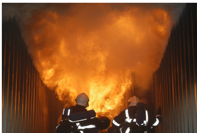
Figuur 1.1 Brandweerlui aan het werk in de Backdraft-cell