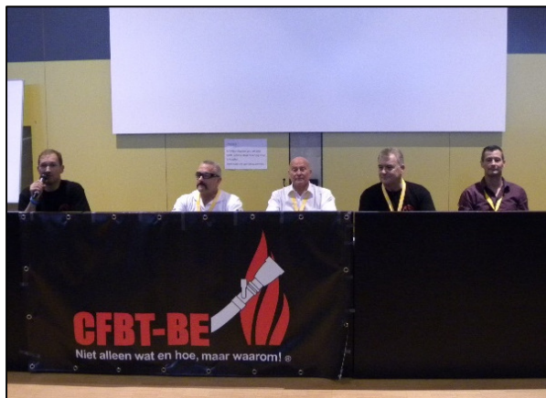
Figuur 4 Panelgesprek met de 4 auteurs van het boek "3D Firefighting".

Andere interessante lezingen werden gegeven door collega's uit Spanje, België, Zwitserland, Frankrijk, Turkije, Zweden en de VS. Het was dus een erg internationale line-up.