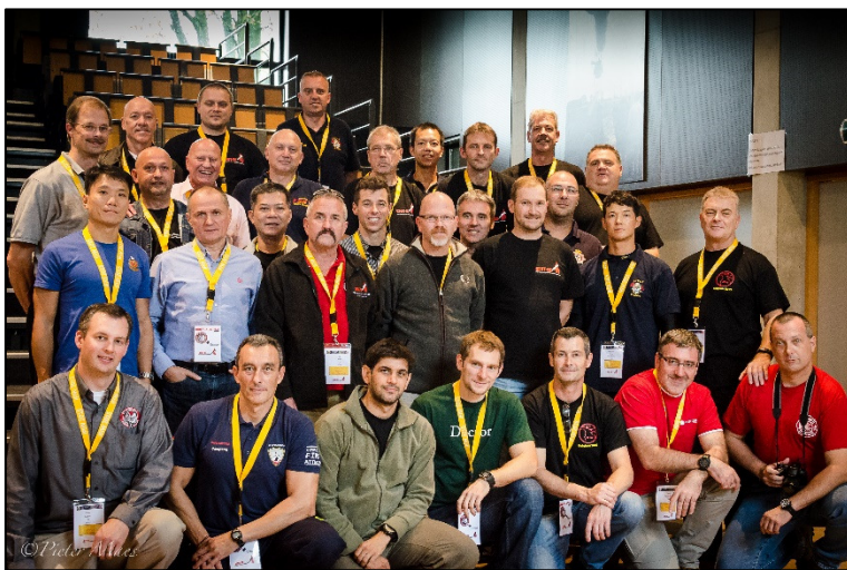
Figuur 1 De aanwezigen tijdens IFIW 2015.