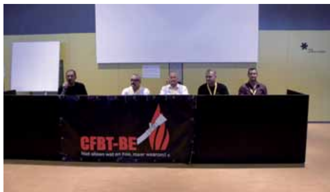
Panelgesprek met de 4 auteurs van het boek 3D Firefighting .