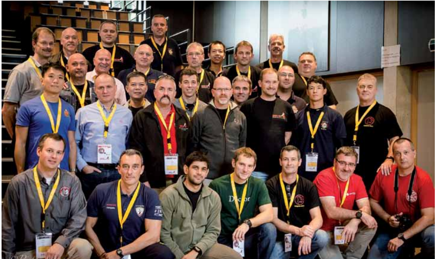
De aanwezigen tijdens IFIW.

Brandweerlieden uit twintig verschillende landen kwamen dit najaar samen op het Open Congres 2015 in België. Het congres volgde op de jaarlijkse bijeenkomst van de International Fire Instructor's Workshop (IFIW).