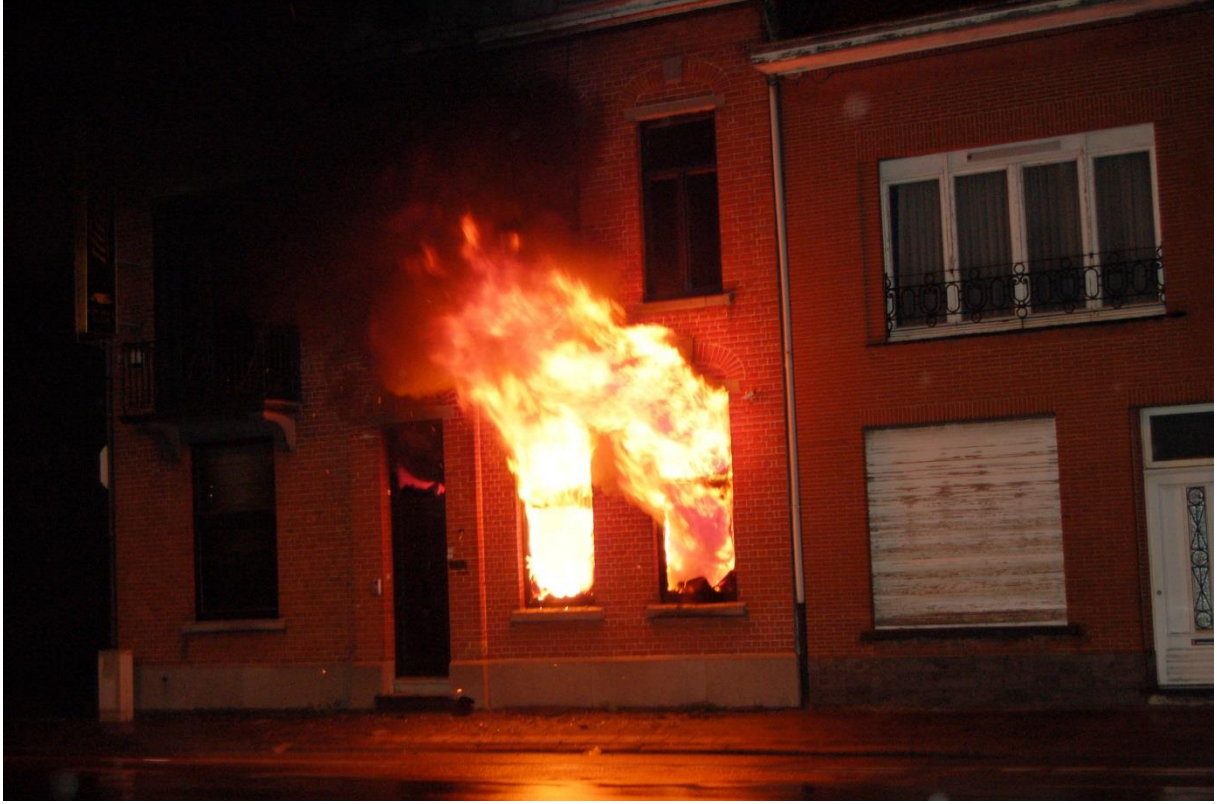
Şekil 3 Bir evin giriş katında tam gelişmiş bir yangın.

Yeni başlayanlar gördükleri şeylerden sonuç çıkarabilirler. Kendisini geliştirmiş veya uzman kişiler görmedikleri şeylerden de sonuç çıkarabilirler.